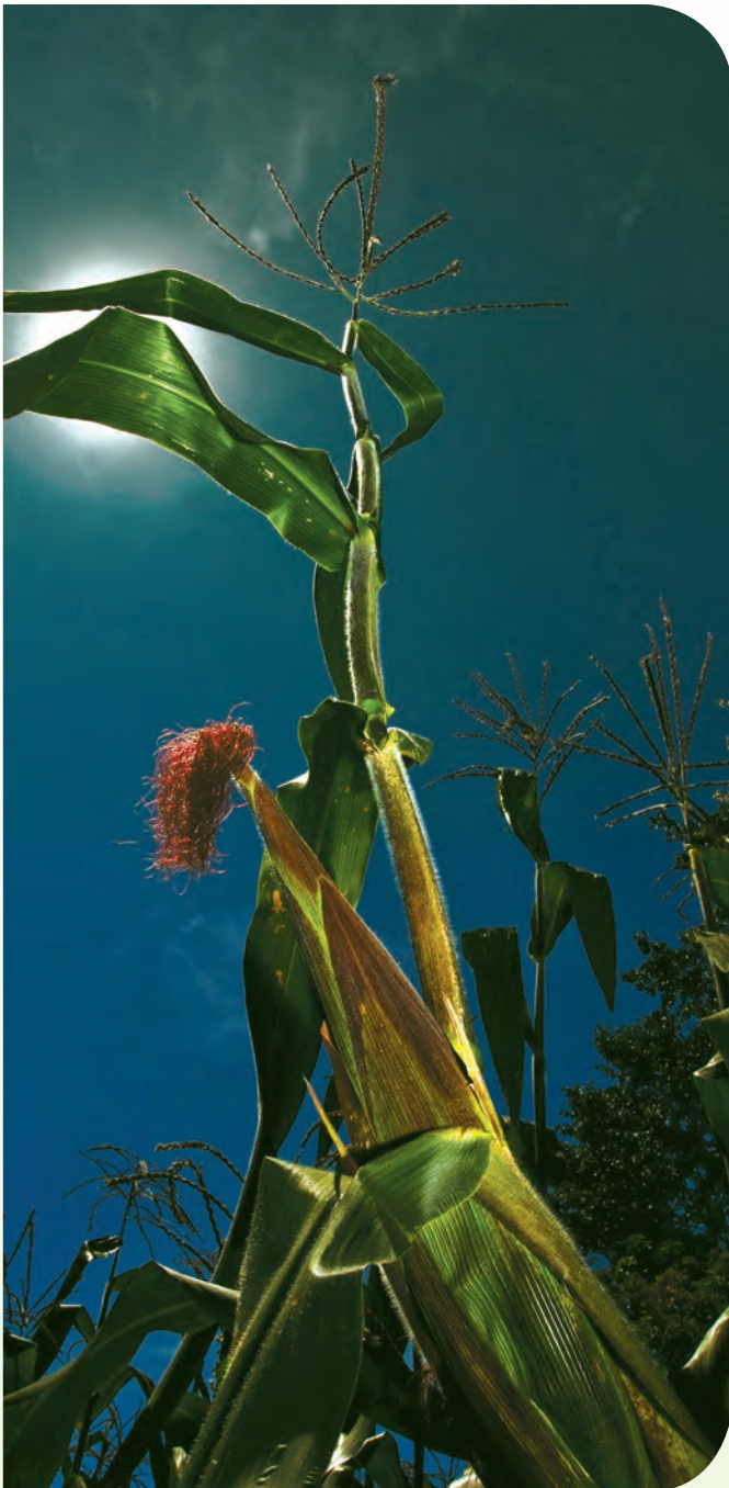
Recuadro 7. Formación de formadores

Poner en marcha programas exitosos de fitomejoramiento participativo requiere capacitación comunitaria al inicio de la intervención, para fortalecer y formar capacidades en los agricultores locales (formación de formadores). Ver recuadro 7.