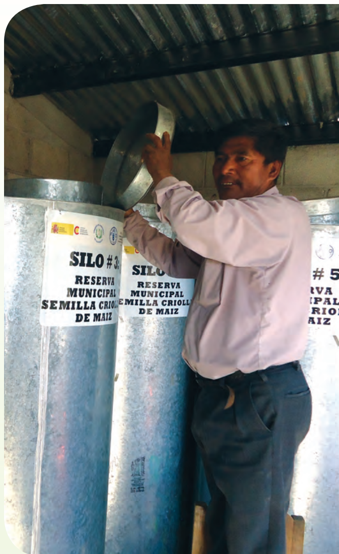
□ Productor de maíz en fase de almacenamiento de su semilla en la RCS.

El FP requiere de la constante retroalimentación de los diferentes actores y ejes de trabajo.