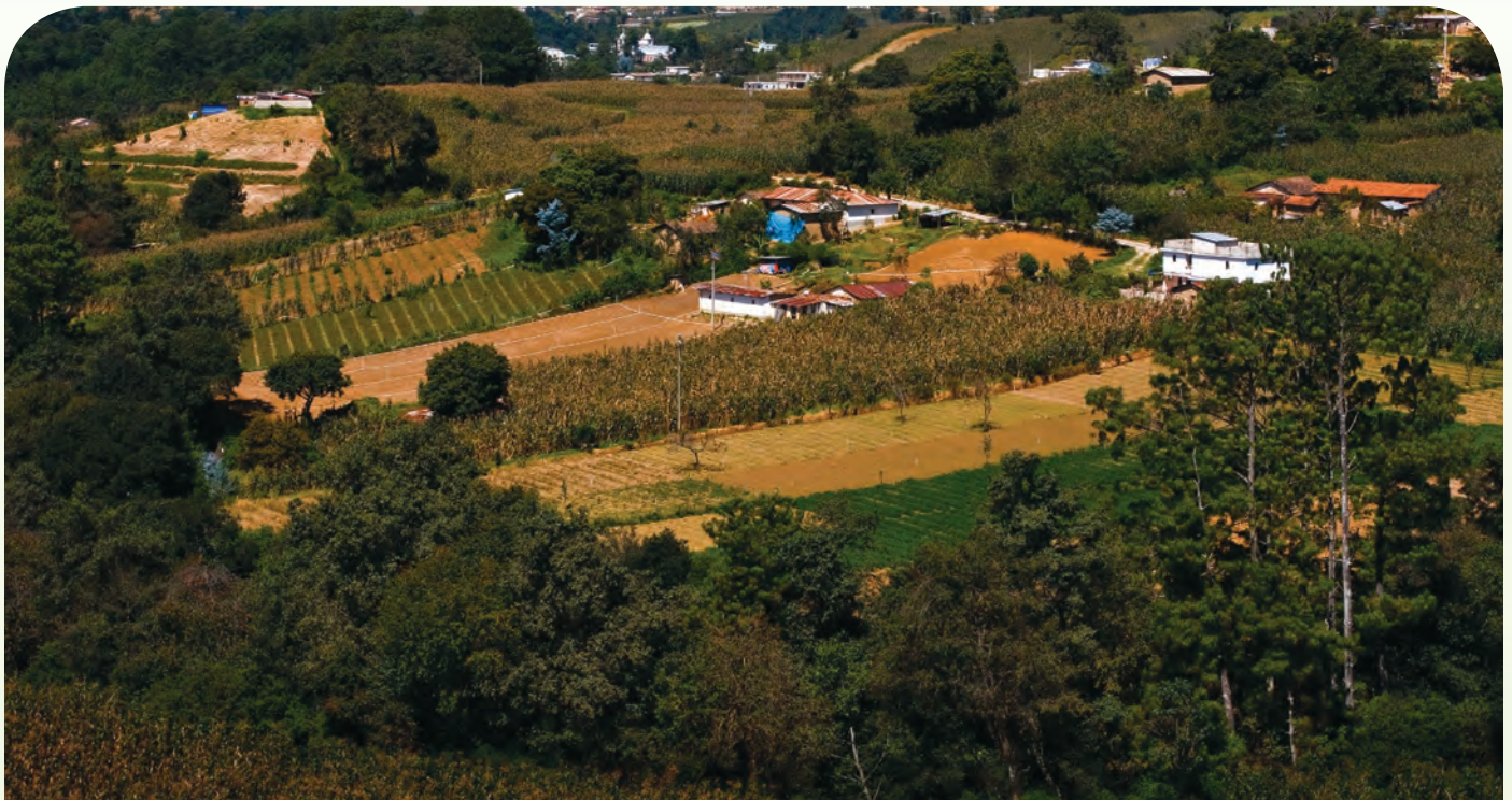
Vista panorámica de siembras de maíz que enmarcan la convivencia directa con los agricultores.

Los sistemas de producción de maíz varían entre los agricultores y áreas geográficas. La delimitación del sistema de producción para implementar el FP se determina con base en el sistema de cultivo documentado en los diagnósticos realizados. Para tomar una