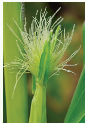
■ Flor femenina.