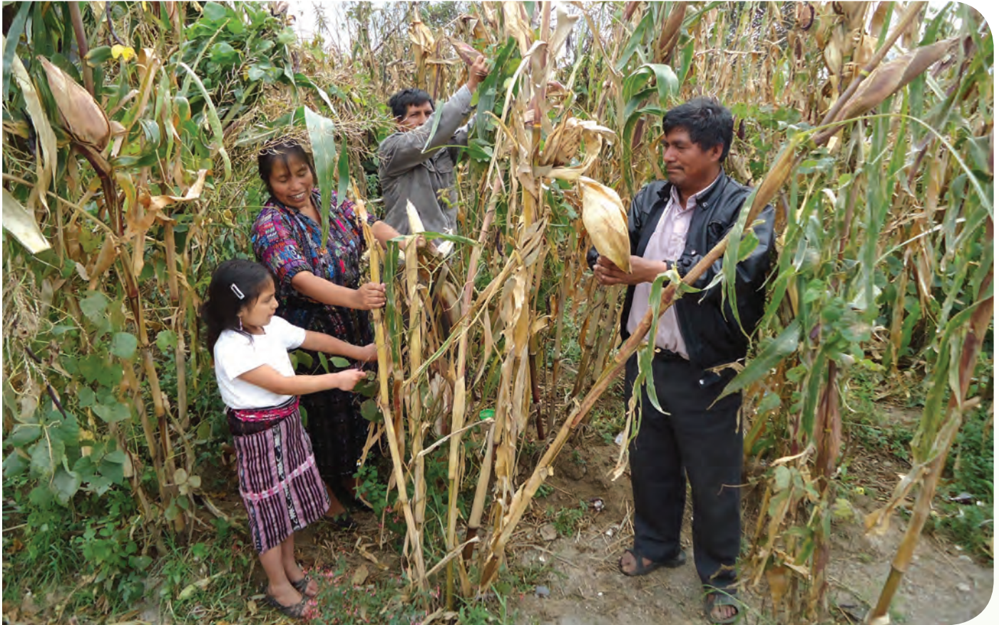
Familia cosechando su maíz.

Esto posibilita la toma de decisiones y contribuye a re-direccionar actividades para conseguir los resultados planificados.