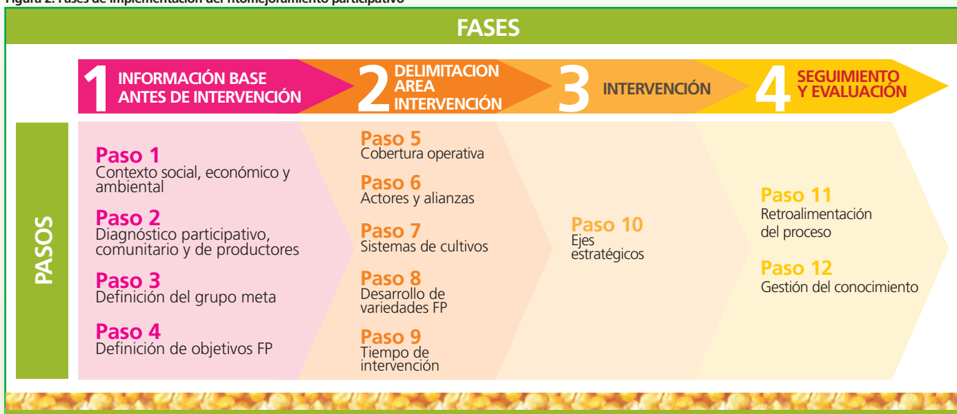
Figura 2. Fases de implementación del fitomejoramiento participativo