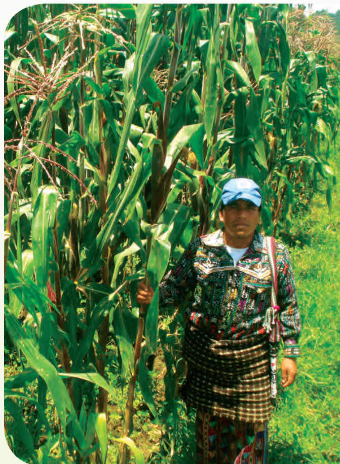
Maíz en desarrollo vegetativo óptimo.