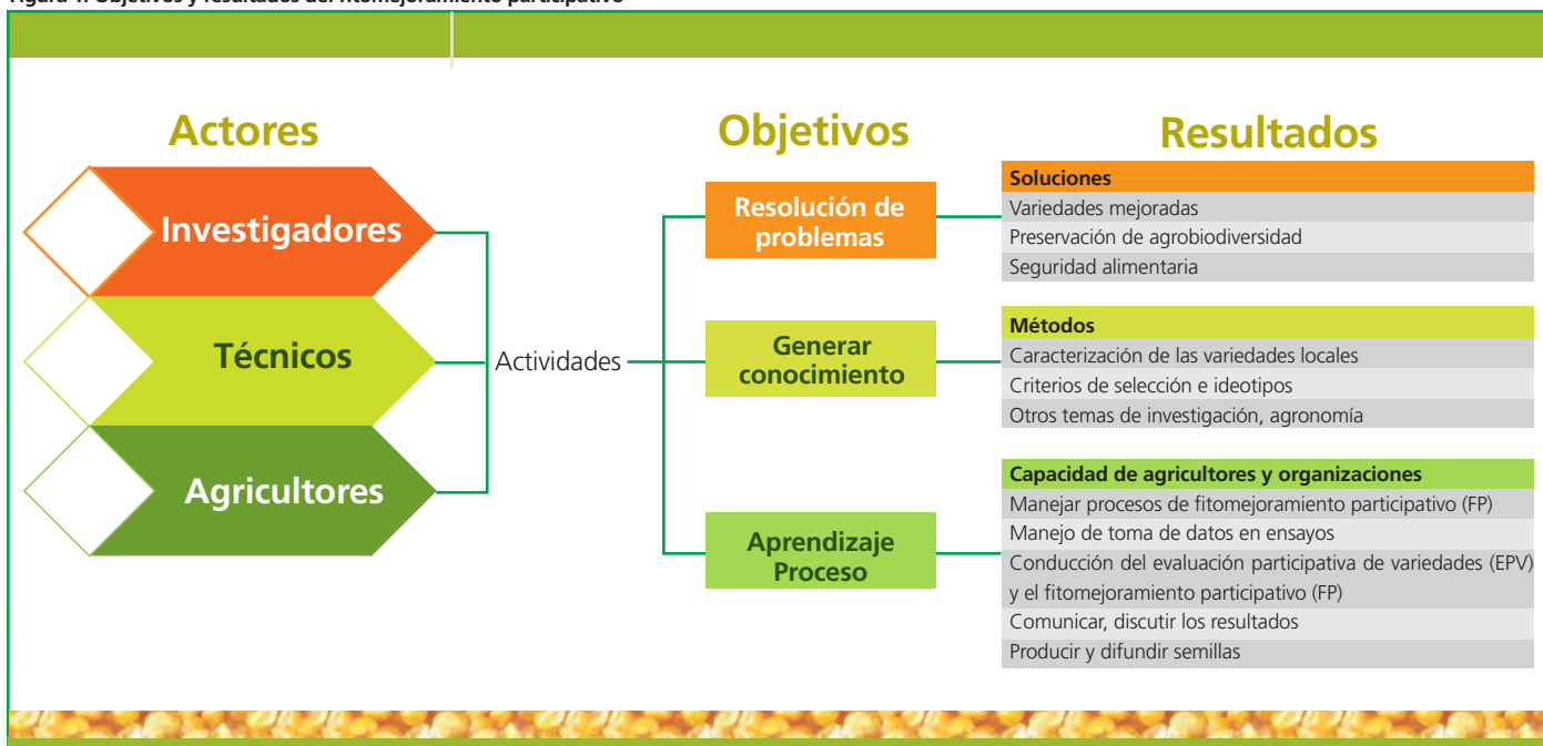
Figura 1. Objetivos y resultados del fitomejoramiento participativo

mas a través del desarrollo de variedades de maíz. El enfoque de estos objetivos se presenta a continuación: