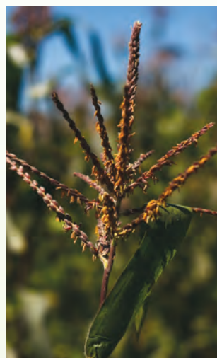
■ Flor masculina.