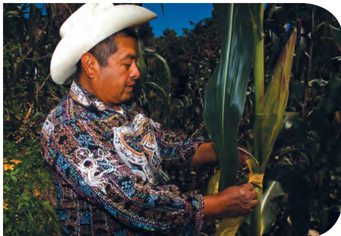
Pequeño productor de maíz, marcando una mazorca.