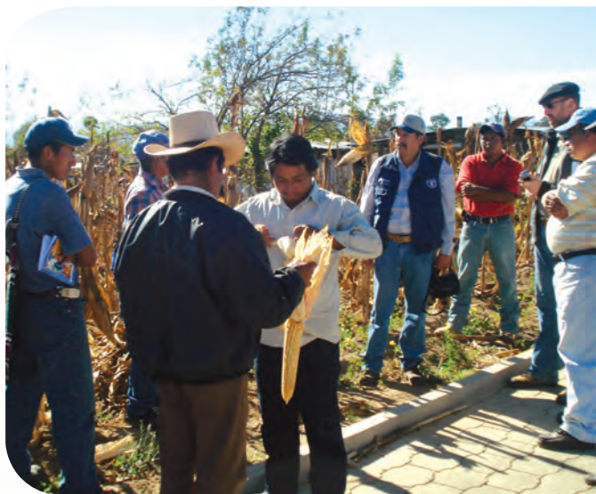
Encuentro entre productores y técnicos.